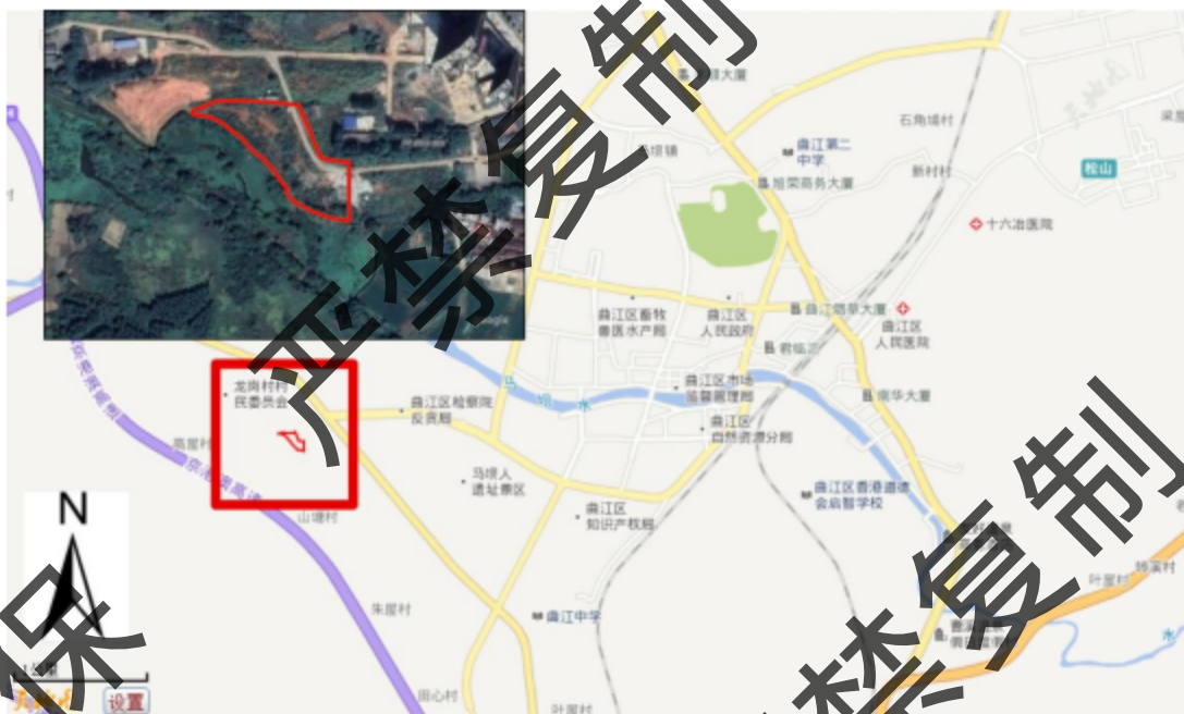
图 3.1-1 项目调查地块地理位置示意图